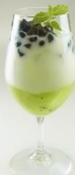
ノンアルコール ドリンク